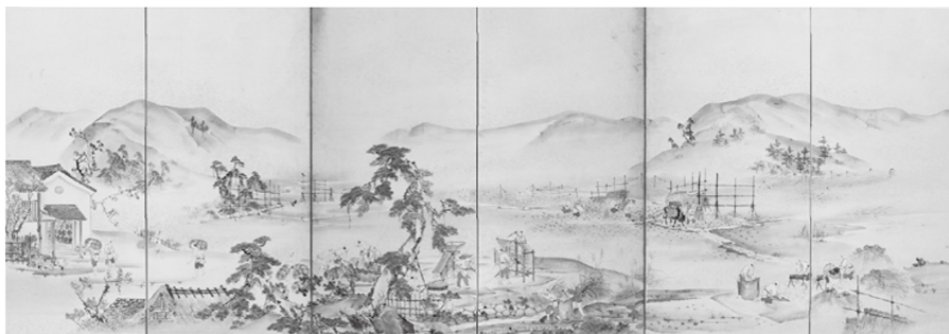
四季耕作図屏風(左隻・当館蔵)