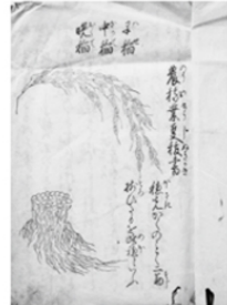
農稼業事抜書(当館蔵)