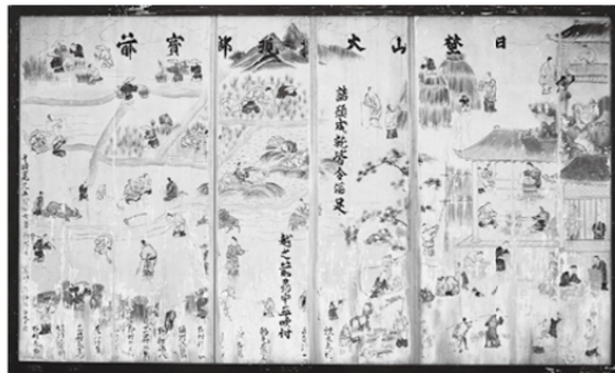
四季耕作図絵馬(複製・当館蔵、原資料：越前市日野神社蔵)

この展示では、巨大な絵馬や色彩豊かな絵巻をはじめ、当館が所蔵する資料を中心に、江戸時代の米作りの様子を紹介します。