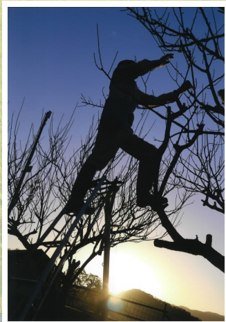
第4回優秀賞 寒空の下で